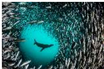
© Enric Sala - National Geographic De Polo a Polo