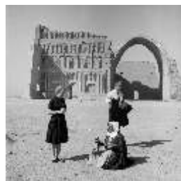
Latif Al Ani