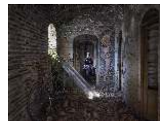
01_Maryam Firusy_ Concurso Women in Photo