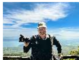
Salida Fotográfica Gonzalo Azumendi