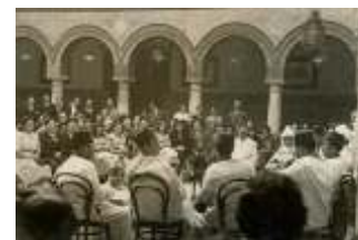
© Zubillaga Arte Marroquí. Córdoba 1946