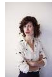
Taller Natasha Christia