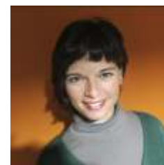
Conferencia Elena Pedrosa