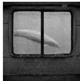
Estela de Castro